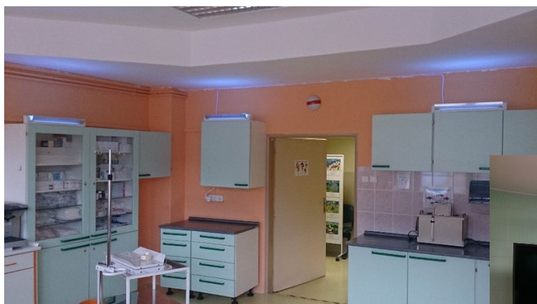
Nemocnice Motol - hematologie

POTRAVINÁŘSKÁ VÝROBA – snížení výskytu bakterií, hub, kvasinek, plísní a dalších mikroorganismů.