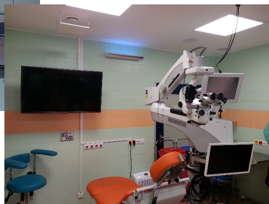
Oční klinika Gemini – operač. sál