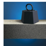
Vysoce pevná v tlaku