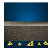
Chrání proti radonu